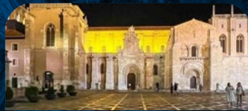
HOTEL REAL COLEGIATA DE SAN ISIDORO Plaza de Santo Martino, 5 / 24003 León