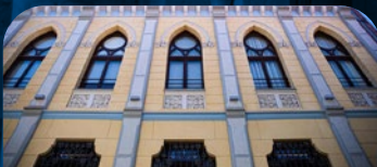
CAMAROTE HOTEL Calle Dámaso Merino, 1, 24003 León